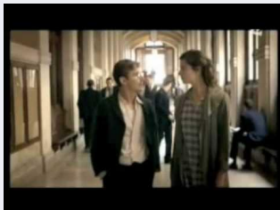
Les amants du Flore