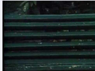
Lecture de La Nausée