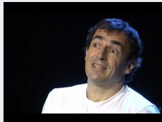
Le bac philo Albert Dupontel