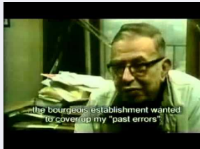
Le Prix Nobel